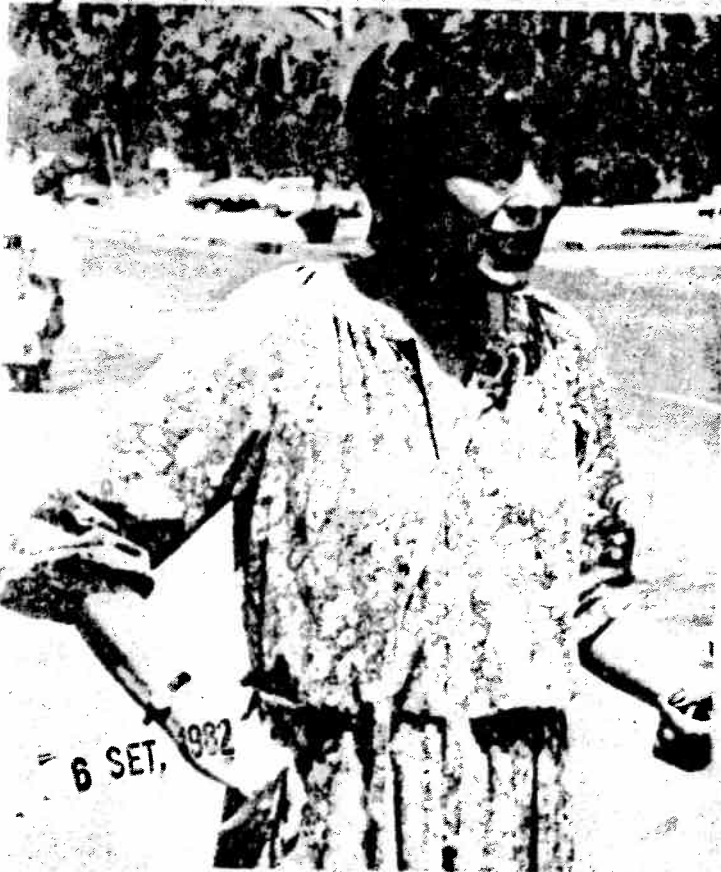
"LOS BANCOS tendrán que seguir trabajando como siempre". (Fotografía de Francisco NAVARRO).