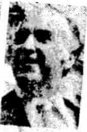
José López Portillo

La decisión de nacionalizar la banca, retirándole la concesión a los particulares que usaron y abusaron de ella para su propio beneficio, ha sido comparada, justa y atinadamente, con la expropiación petrolera que en 1938 decretó el Presidente Lázaro Cárdenas, quien durante su campaña electoral externó algunos conceptos que hoy cobran vigencia, como cuando sostuvo: