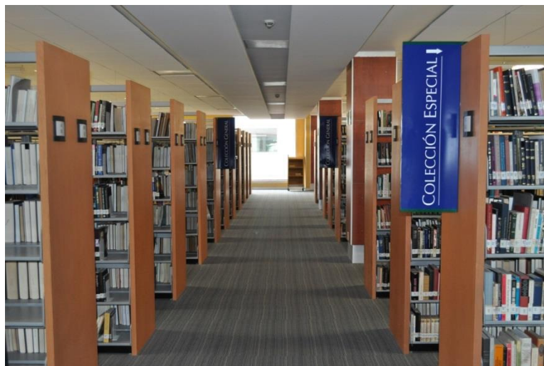
Colección general y colección especial ubicados en el piso 1.

El CIB ofrece una interesante oferta de servicios a su comunidad de usuarios. Actualmente se tiene acceso a 40 bases de datos en texto completo y referencial con acceso a libros electrónicos, tesis, documentos de trabajo, revistas académicas y de difusión, además de contar con información estadística. La Biblioteca tiene establecidos 177 Convenios de Préstamo Interbibliotecario con instituciones nacionales e internacionales afines a las líneas de investigación y docencia del CIDE. De esta manera se cubren importantes necesidades de información de la comunidad a la que sirve. En la Biblioteca se administra el Repositorio Digital CIDE que contiene 3, 676 archivos (tesis, documentos de trabajo, artículos etc.). La Biblioteca pertenece a la red de consulta externa del INEGI, al inicio fungió como depositaria de la información impresa que producen y actualmente el Instituto ofrece asesorías especializadas de información a través de esta red.