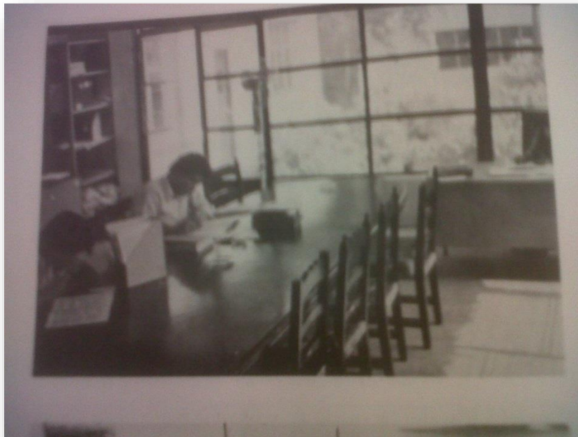
Foto encontrada en un folleto publicado en 1982. Probablemente sea la Biblioteca.