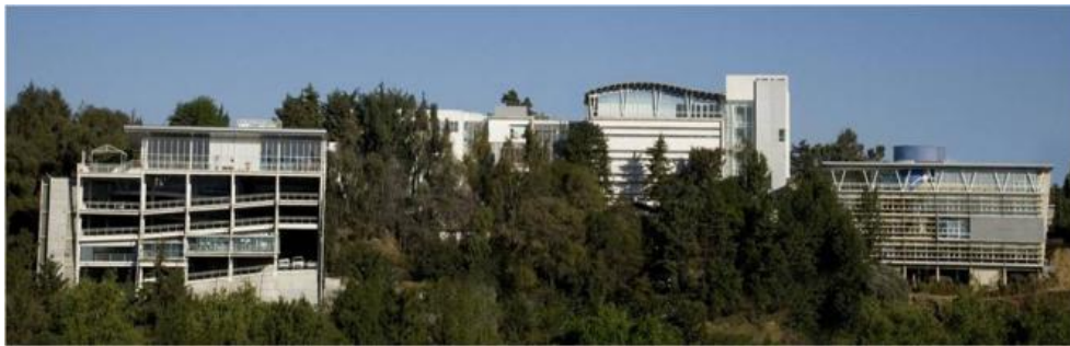
Vista panorámica del CIDE desde Santa Fe, se aprecia la ubicación del CIB en el campus

Con el paso de los años y vaivenes en la Institución, se refuerza la idea de edificar una Biblioteca y convertirla, al menos con su actual ubicación física, en el centro de la vida académica del campus Santa Fe. Entonces se construyó el Centro de Información y Biblioteca (CIB) que se inauguró en el 2007.