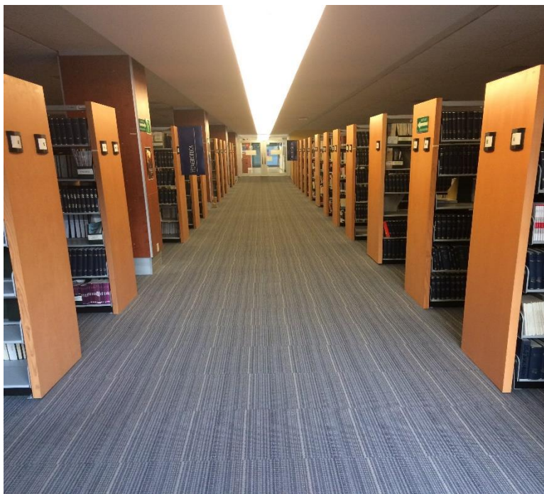
Colección General, Hemeroteca y documentos de trabajo en el piso 2.

La Biblioteca a través de los años no ha sufrido un cambio sustancial en la forma en que se encuentran divididos sus acervos: Sala de Referencia, Colección de Reserva, Acervo General, Hemeroteca, Colección Especial, Colección INEGI 33 y Colección Documentos de Trabajo.