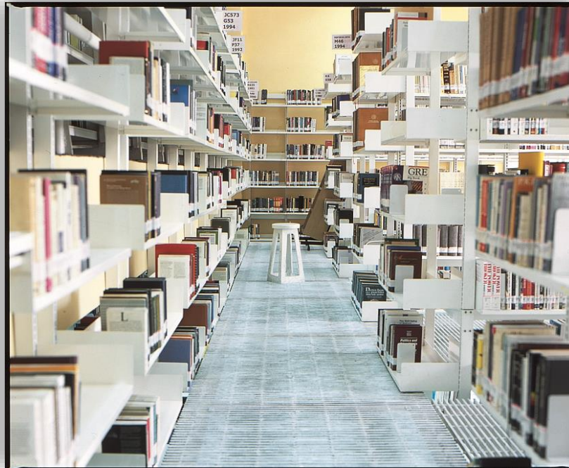
La estantería de la biblioteca durante los noventas y parte de la década del 2000