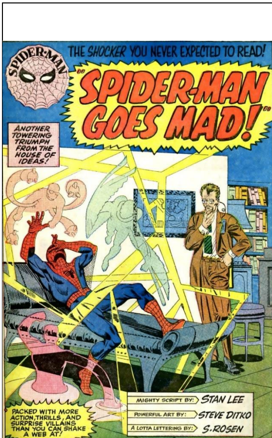
Imagen 2: En este cómic de mayo de 1965, se puede apreciar los créditos de Stan Lee, Steve Ditko y Sam Rosen. Si bien es posible que hayan participado más personas, no aparecen en los créditos finales de publicación. Stan Lee, Steve Ditko y Sam Rosen, The Amazing Spider-Man , Marvel Comics, núm. 24 (mayo 1965): 1. Digitalizado por el autor para esta tesis.

más antiguos, es más difícil reconstruir su trayectoria debido a que no todos los autores dejaron un archivo en el cual se encuentren resguardados bocetos de sus obras. Conocer la trayectoria de los autores nos permite comprender las relaciones profesionales y personales de los autores y cómo éstas influyeron en el proceso de elaboración de historias y personajes.