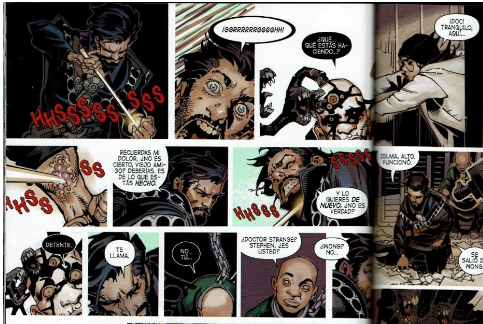
Imagen 10, Ejemplo de sonido 2: Onomatopeya. En este caso, el sonido es provocado por la acción del personaje (tipografía en color rojo) 72