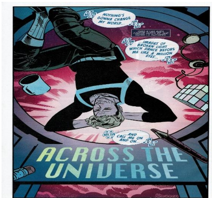
Imagen 11, Ejemplo de Sonido 3: ruido del ambiente. Si bien este sonido es resultado de una acción del personaje, la ejecución musical es emitida por un dispositivo. 73

Estos tres ejemplos, en tres tiempos diferentes y de diferentes artistas, nos exponen el sonido como una herramienta elemental para el desarrollo de sus historias. La presentación del