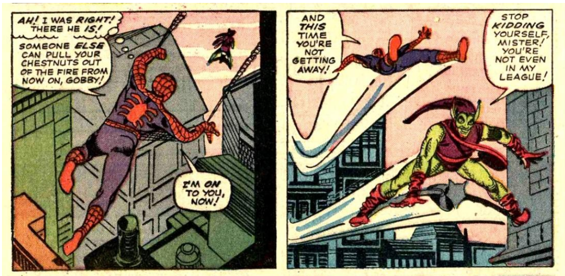
Imagen 9, Ejemplo de sonido 1: diálogo. Sonido emitido intencionalmente por los personajes. 71