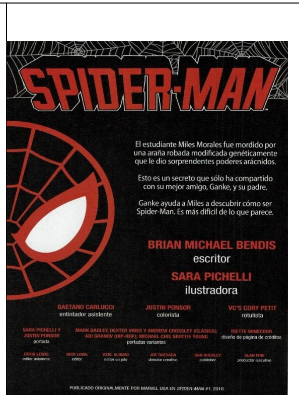
Imagen 3: En esta página introductoria de un cómic del siglo XXI, se puede notar mayor reconocimiento de los artistas involucrados en cada número. Brian M. Bendis, Sara Picheli, Gaetano Carlucci, Miles Morales Spider-Man, Marvel Comics México, núm. 1 (marzo 2016): 4. Digitalizado por el autor para esta tesis.

La intencionalidad es otro de los puntos más importantes del cómic. En la cuestión política, el cómic puede estar supeditado a peticiones, ideas o prácticas culturales por parte del mercado editorial. Para el capítulo 2, los elementos visuales que contienen una ideología política o cultural se abordarán con mayor profundidad, ya que se enfocará en el contexto histórico y desarrollo del cómic en la década de 1960.