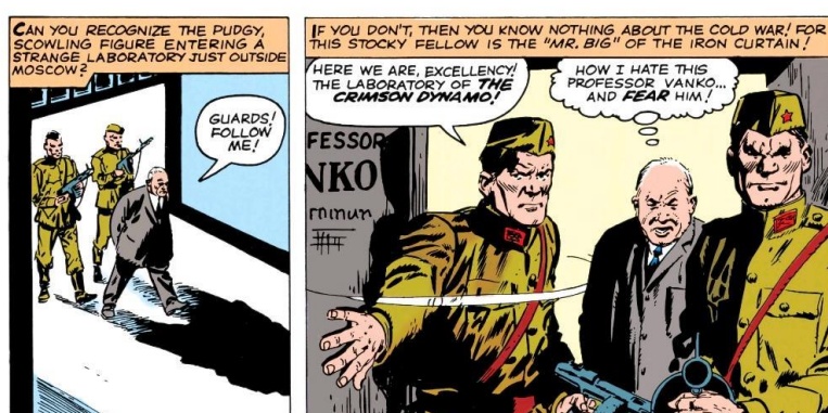
Imagen 14: Stan Lee, R. Berns, Don Hecks y Art Simek, Tales of Suspense #46 (Marvel Comics, octubre de 1963), 2. Acervo Digital Marvel Unlimited.

Siguiendo con la narrativa de los enemigos de Thor , en Tales of Suspense ( Cuentos de Suspenso ) también presentan a los comunistas como traidores y despiadados tanto con sus enemigos como entre ellos mismos. El ejemplo más claro de esto ocurre en los números 42 y 46. En el primero, el villano a vencer, conocido como “El bárbaro rojo” quiere robar algunos planos de los inventos de Stark para su causa, por lo que contrata a un espía que puede tomar cualquier forma. Lo interesante de esta trama es la primera aparición informal de Jrushchov. 133