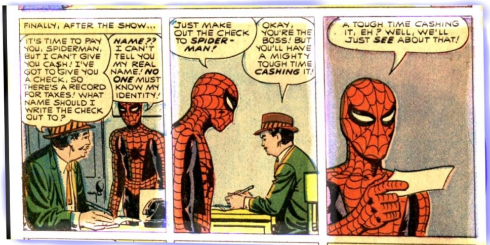
Imagen 8: Como se puede apreciar en esta imagen, “las canaletas” (resaltadas) dividen las viñetas sin embargo, marcan de forma coherente una secuencia en la historia. Gracias a esto, el lector puede completar su lectura haciendo el ejercicio de imaginación e interpretación en los espacios “vacíos”. 69