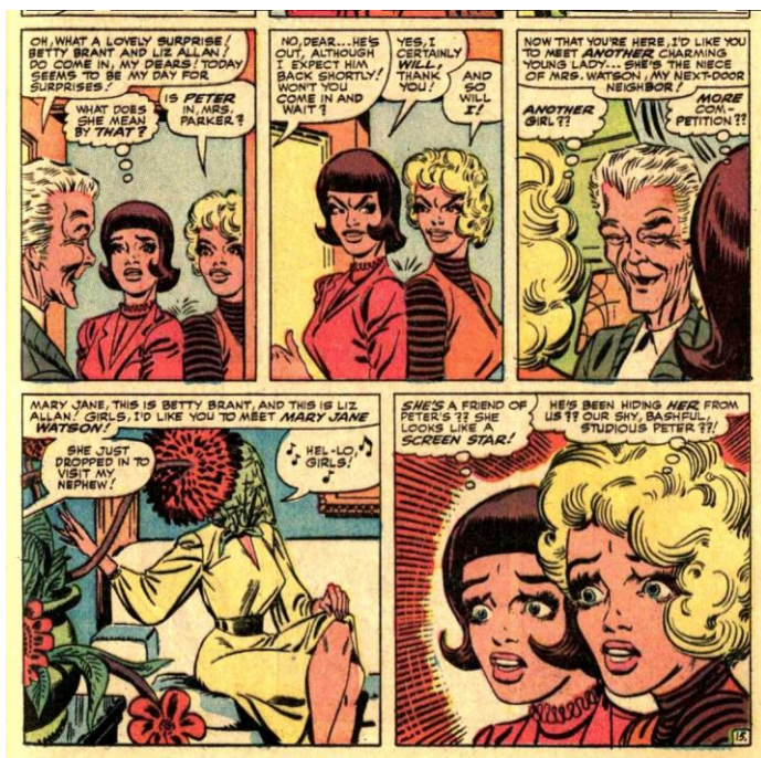
Imagen 17: Stan Lee & Steve Ditko, The Amazing Spider-Man , núm. 24 (mayo 1965): 20. Eaton Collection, Universidad de California, Riverside.

del autor, decidió que Peter rechazaría una y otra vez aquella cita ya que, en palabras de Lee, “era vergonzoso salir en una cita arreglada por tus padres”. Al igual que Peter, el lector no conoció el rostro de Mary Jane Watson hasta el número 42 sin embargo tuvo una