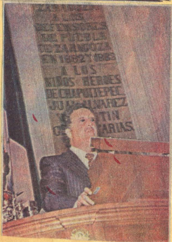
EL SOL DE MEXICO MEXICO, D. F.