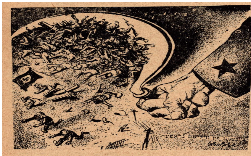
Imagen 15. William Gropper