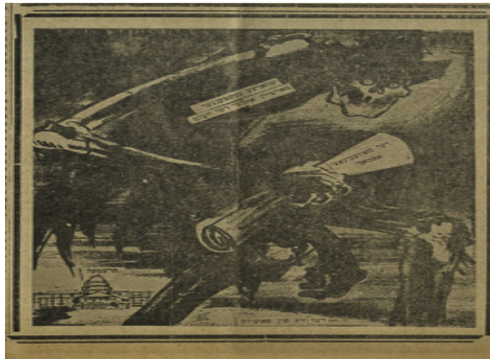
Imagen 11. “Los fantasmas negros marchan por el mundo”