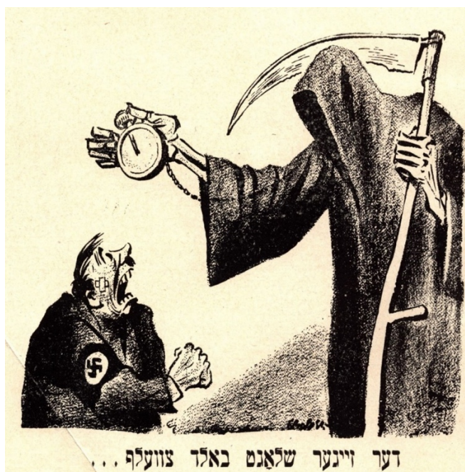
Imagen 20. El reloj pronto marcará las doce

Las derrotas que iba infirigiendo el Ejército Rojo marcaba el fin del régimen nazi, Grooper con el clásico dicho “El reloj pronto marcará las doce” (Imagen 20) anunciaba el momento más oscuro para Hitler y sus allegados. Mostrando al ángel de la muerte sostenido con una mano la guadaña y mostrando un reloj que está a punto de llegar a la medianoche, Hitler de rodillas desesperado y magullado. En julio los soviéticos habían recuperado la zona de Minsk en Ucrania y los días que le siguieron provocaron la captura y huida de alemanes que estaban en las ciudades cercanas como Vilna, Lida y Baranovich. Mientras que en el frente ruso se capturó Grodno y Bialistok. 362 Los antiguos hogares judíos fueron recuperándose a lo largo de la contienda. Sin embargo, ya no había judíos en aquellos lugares y sólo quedaban vestigios de lo que alguna vez fue el Alter Heim . Estos espacios jamás volvieron a los dueños originales dejando una marca profunda para los judíos que lograron escapar.