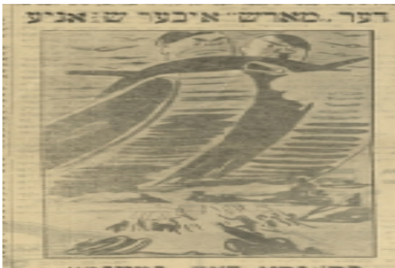
Imagen 9. La marcha sobre España