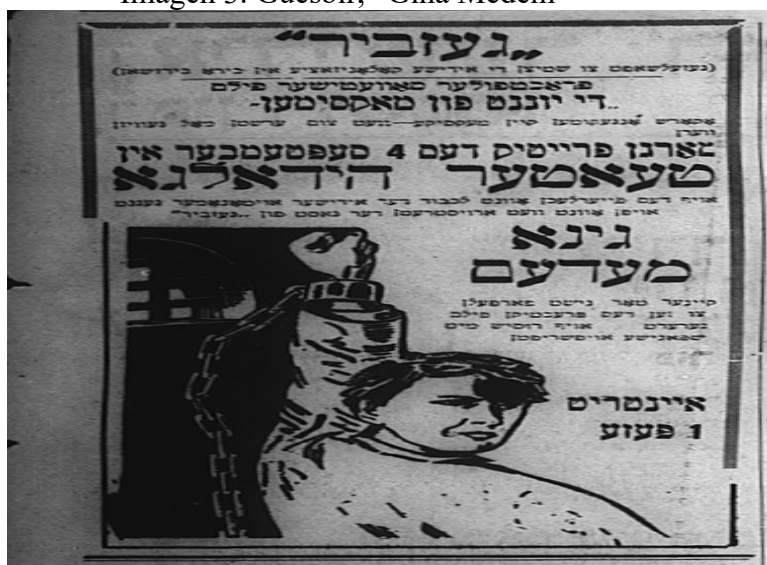
Imagen 3. Guesbir, “Gina Medem”