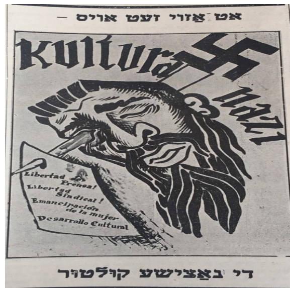
Imagen 6. “At azdi zet oys di nazishe kultur.”

Con la leyenda dice: Libertad de Prensa, Libertad Sindical, Emancipación de la mujer y Desarrollo Cultural.