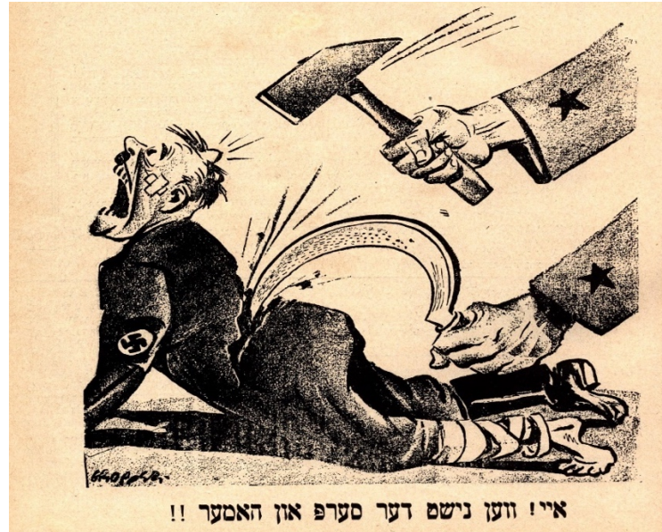
Imagen 19. Si no es la hoz es el martillo