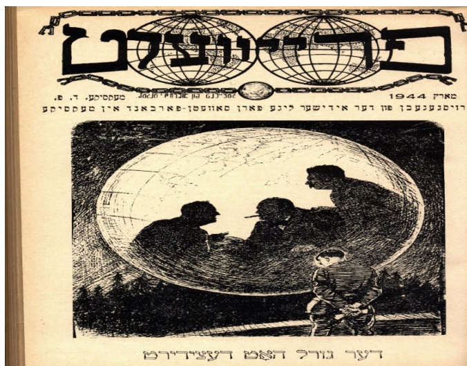
Imagen 17. El destino se ha decidido

Tras el avance del Ejército Rojo y las victorias sobre los alemanes, Grooper usó la gráfica para representar la derrota de la armada nazi. El grupo de aliados surge a raíz de la petición de abrir dos frentes para el ejército de Hitler. El artista mostró el destino de Hitler en cada número en la portada del Fraiwelt siempre vanagloriando a Stalin y sus fuerzas armadas. La portada de marzo de 1944 muestra a un Hitler viendo hacia la luna donde se muestra una sombra con las figuras de Josef Stalin de lado derecho, el presidente de Estados Unidos Franklin Roosevelt (1882-1945) de lado izquierdo y en medio el Primer Ministro de Inglaterra Winston Churchill (1874-1965). Debajo de la imagen se observa la leyenda “El destino se ha decidido.” (Imagen 17) La imagen representa la Conferencia de Teherán que se realizó a finales de 1943 siendo la primera reunión donde los tres aliados convivieron en un mismo espacio con la intención de planear los ataques en contra de Alemania. El propósito de la reunión fue plantear un ataque simultaneo entre el frente oriental y occidental para acorralar al ejército de Hitler. Además, se discutió el control territorial de Alemania y la península balcánica en caso de ganar la guerra, limitando los planes de expansión de la URSS. 354