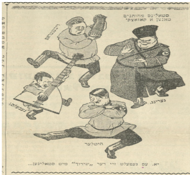
Imagen 12. “Les gustó la aventura con Stalin”