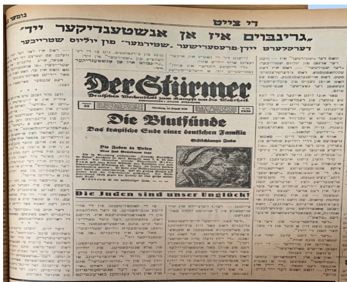
Fuente: Di Tzait , el 25 de septiembre de 1936, Núm. 33 Año I.

La prensa idish siguió muy de cerca los acontecimientos de la Guerra Civil española, porque a raíz de este conflicto se suscitaron una serie de problemas que existieron entre la comunidad ashkenazi de México, tales como la colonización y la posesión de la tierra y la integración de colectivos a la lucha antifascista, cada uno con sus propia agenda ideológica y política. El rastreo y la evidencia del antisemitismo permitió resaltar la preocupación de las editoriales sobre el resto de los judíos que se encontraban en Europa. Ante esto, el temor de una nueva guerra y sus repercusiones en la población judía que se hicieron realidad como veremos en el siguiente capítulo.