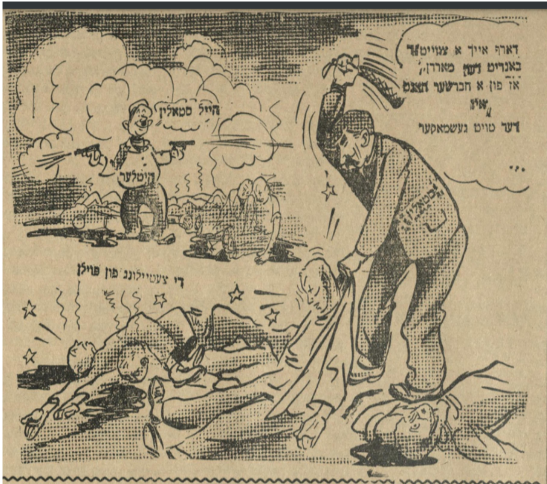
Imagen 13. “¿Necesitas un segundo bandido para matar?”