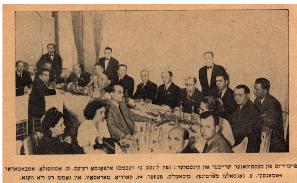
Imagen 16.Reunión de Escritores y Artistas.