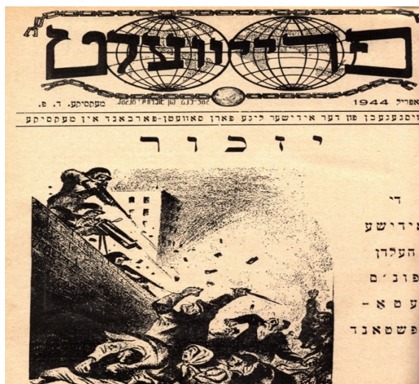
Imagen 18. Recordar, Los héroes del Levantamiento del Gueto

El 19 de abril los alemanes abrieron una brecha en el gueto de acuerdo con el diario de Mary Berg (1924-2013) sobreviviente del Gueto de Varsovia, la artillera dirigió un intenso fuego en contra del gueto, derribando casas y cualquier tipo de construcción, las personas que intentaron huir por el drenaje fueron masacradas, los combatientes quedaron esparcidos por lo que fue una vez el gueto, junto con los solares que había alrededor.