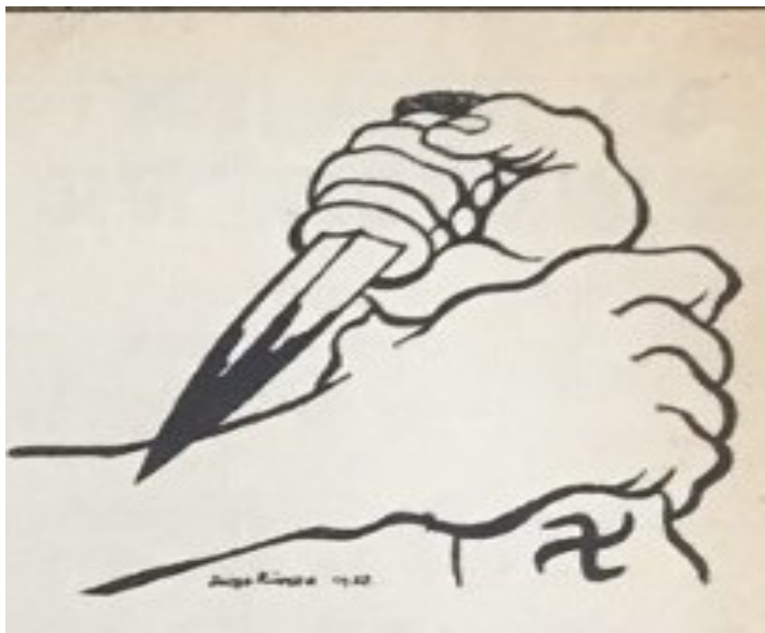
Imagen 7. Firma de Diego Rivera.