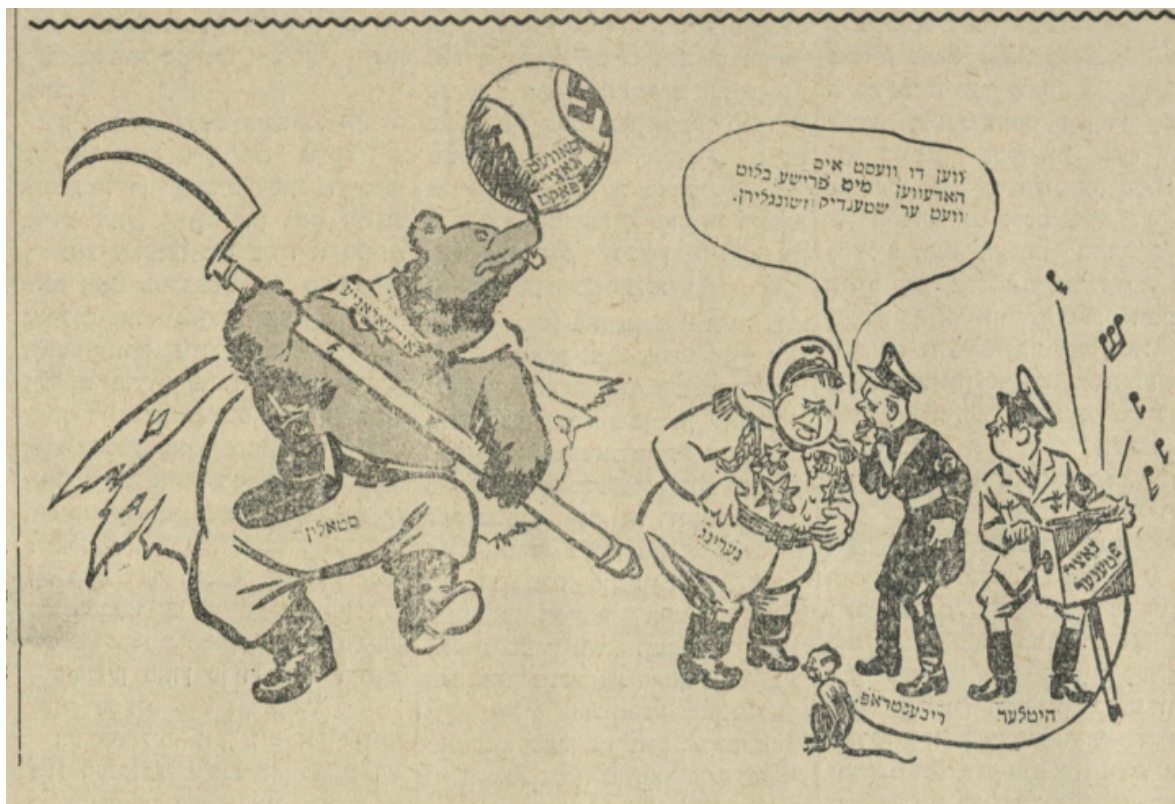
Imagen 14. “El oso ruso”