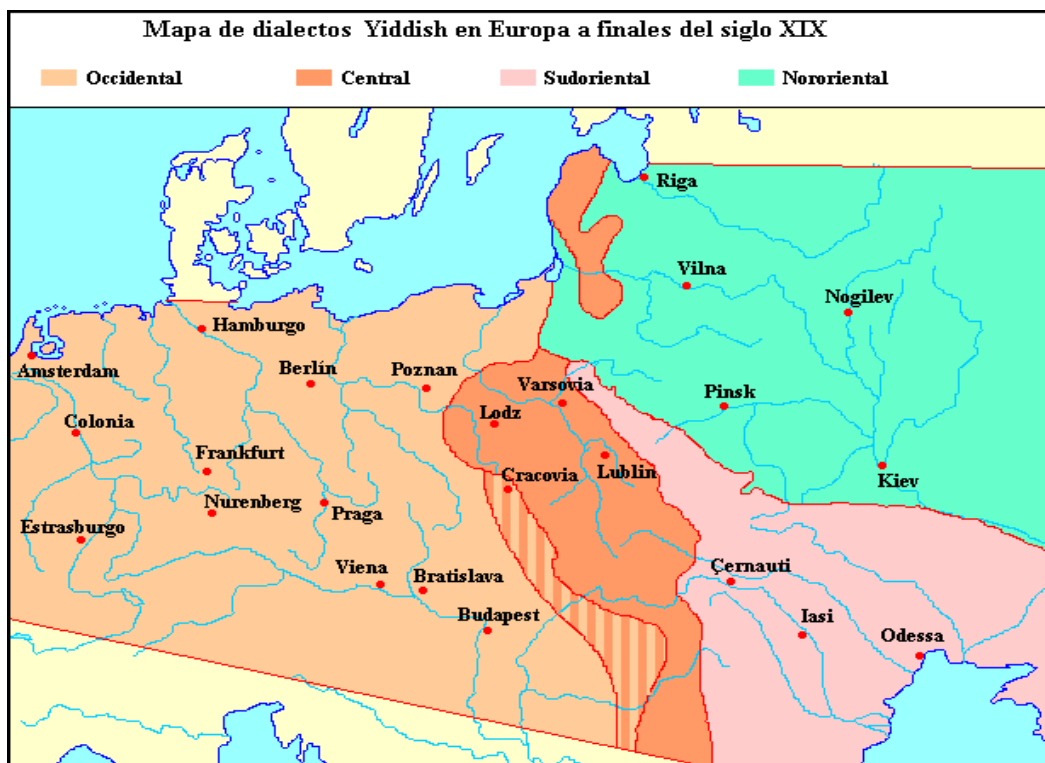
Mapa 1. Los lugares donde se hablaba idish