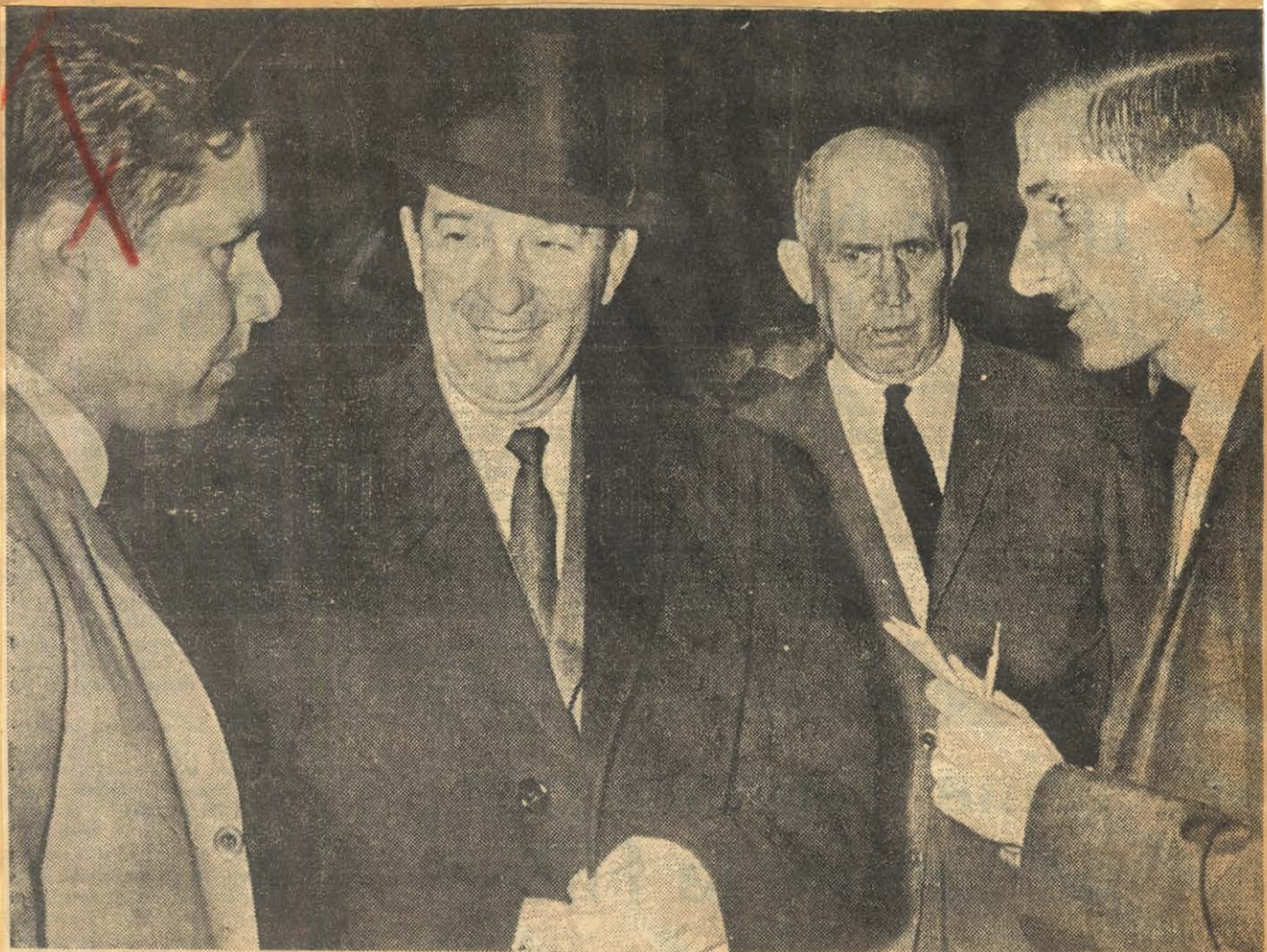
EL SECRETARIO de Hacienda y Crédito Público, licenciado Antonio Ortiz Mena, es entrevistado por los periodistas en el Aeropuerto Internacional de la Ciudad de México, anoche, a su llegada, procedente de Europa, a donde fue a recibir el importe de los bonos mexicanos puestos a la venta con todo éxito entre inversionistas de ese continente. En la foto se ve también al señor Rodrigo Gómez, director del Banco de México.