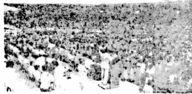
CULIACAN, Sinaloa.— Los habitantes del municipio del centro de Sinaloa, (Culiacán, Mocorito, Angostura, Salvador Alvarado y Badiraguato), respaldaron los decretos de nacionalización de la banca y control general de cambios pronunciados por el primer magistrado de la nación.

En el puerto de Mazatlán los oradores indicaron que la nacionalización de la banca es un golpe decisivo a los enemigos de México, a los que quieren aprovecharse del esfuerzo de las grandes mayorías para favorecer a unos cuantos y proteger sus propios intereses.